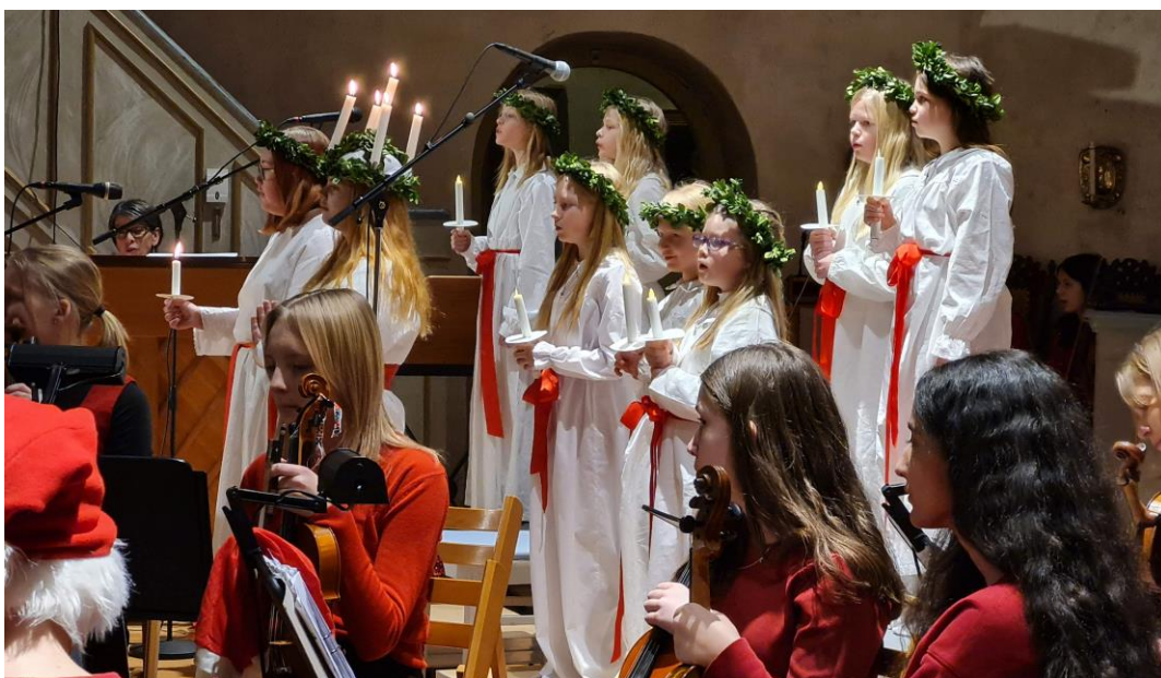
Luciakonsert i Segerstadskyrka 2022.

Kom också ihåg våra Pubar som hålls sista fredagen i varje månad.