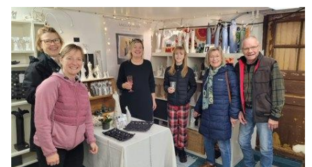
Nypremiär i keramikateljén Änglajorden